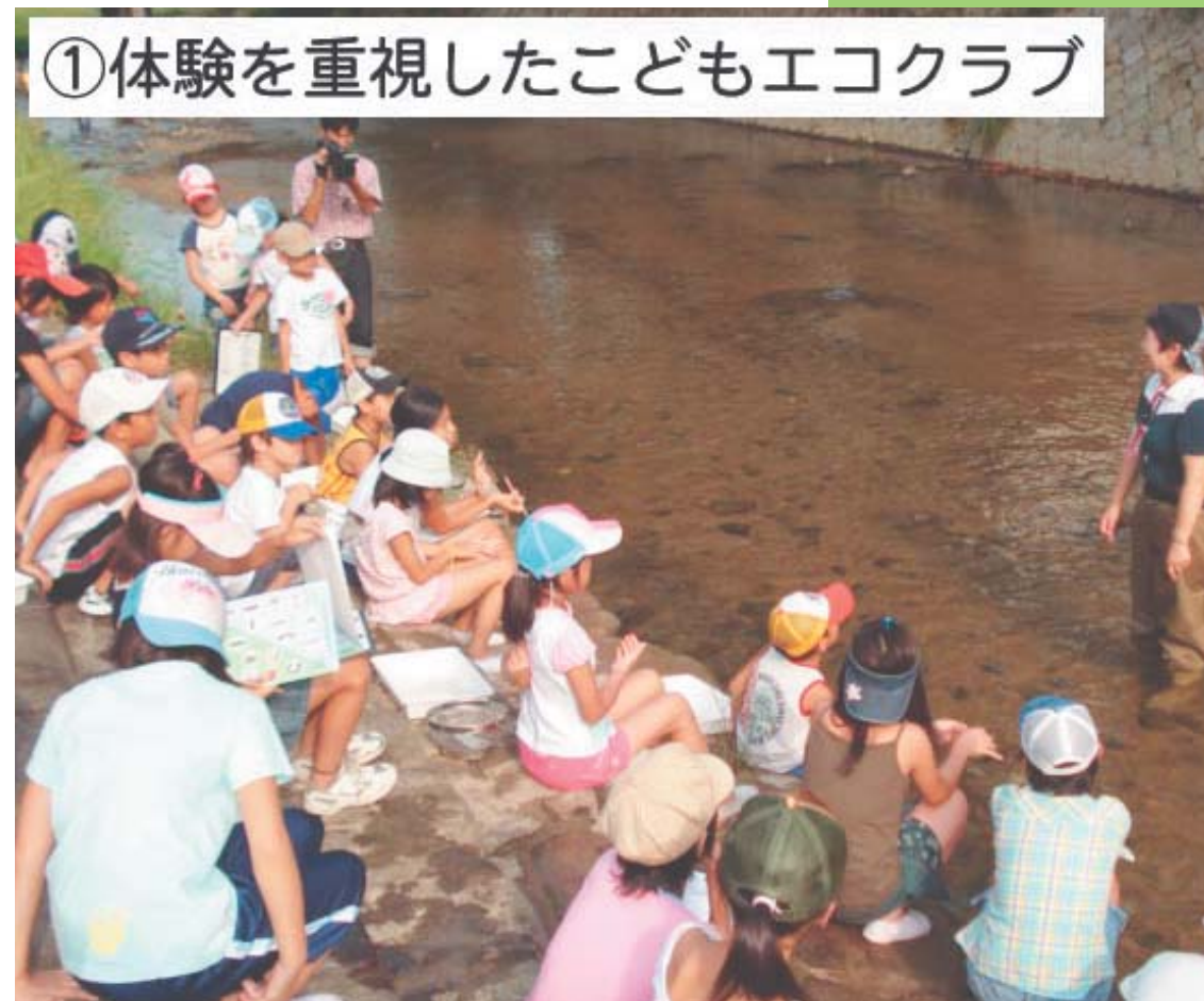
①体験を重視したこどもエコクラブ