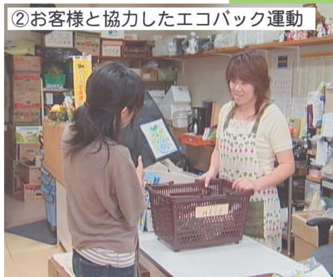
②お客様と協力したエコバック運動